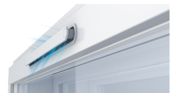
Raikas ilma virtaa tasaisesti sisäpuiteeseen asennetusta avoimesta venttiilistä.